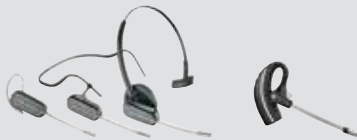
SAVI 440/445 Konvertibles Modell