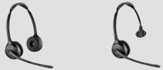
SAVI 420 Kopfbügelmodell (binaural)